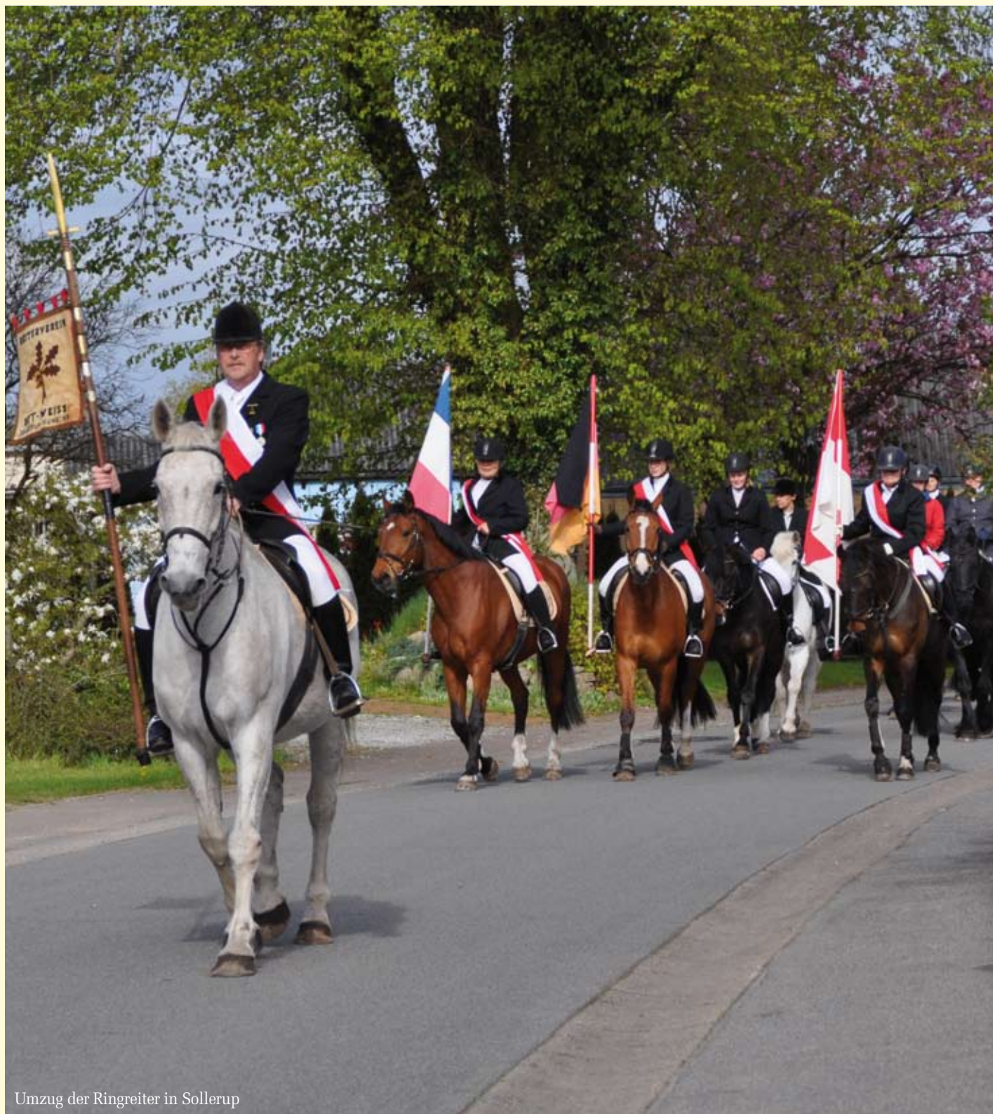
Umzug der Ringreiter in Sollerup