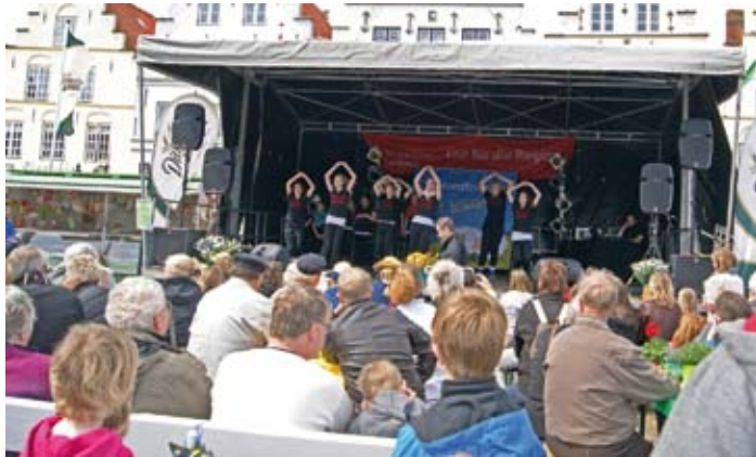
Die Tanzgruppe „Hot Chilies“ erobern die Bühne und das Publikum

Das gesamte Organisationsteam bedankt sich an dieser Stelle bei allen Aktiven und Ausstellern für ihre tatkräftige Unterstützung. Ohne dieses Engagement wäre der 9. Regionaltag nicht so gelungen und stimmig geworden. Wir freuen uns schon auf den 10. Regionaltag, denn „hier bewegt sich was!“.