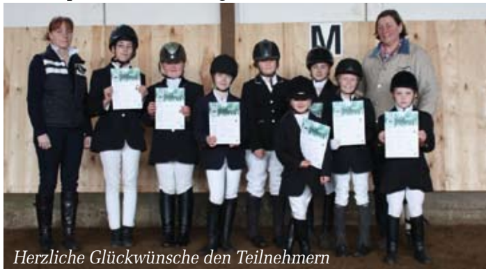
Herzliche Glückwünsche den Teilnehmern

Bei der praktischen Prüfung absolvierten die Kinder eine einfache Abteilungsauf-