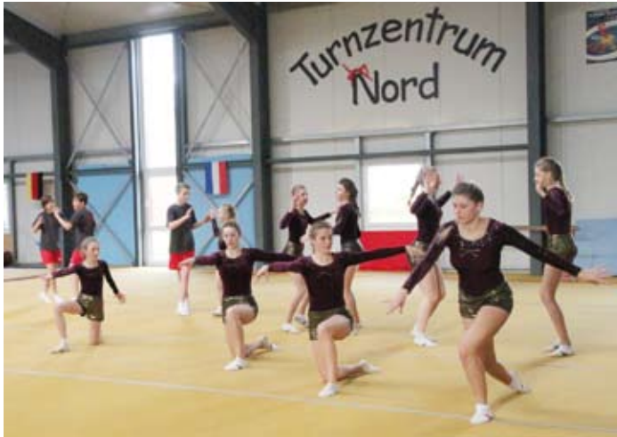
Mit einer beeindruckenden Showvorführung stellte sich das Turnzentrum Nord vor

Ein erster großer Schritt ist gemacht. Im Rahmen des Weihnachtsdorfes Wanderup hat sich das Turnzentrum Nord bei einer öffentlichen Veranstaltung vorgestellt. Seit drei Jahren wird gegründet, gestaltet und gebaut. Nun sind die 500 qm große Turnhalle und der etwa 120 qm große Gymnastikbereicheröffnet, die eingeschlossene