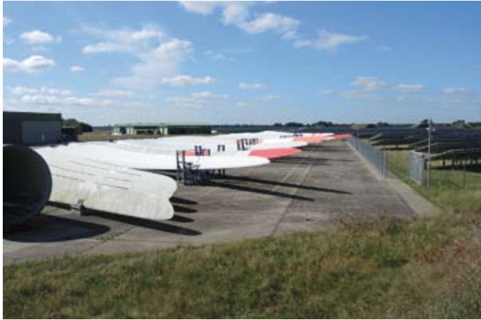
Zahlreiche Flügel von Windkraftanlagen lagern verstreut auf dem ehemaligen Flugplatzgelände

Der Entwurf des Bebauungsplanes Nr. 12 befasst sich ebenfalls mit dem nördlichen Bereich des ehemaligen Flugplatzes. Nach den Vorgaben der Landesplanung sind in diesem Bereich untergeordnete gewerbliche Nutzungen zulässig. Dabei handelt es sich schwerpunktmäßig um Lagerhaltungen sowohl in den ehemaligen Bundeswehrhallen als auch auf den großen asphaltierten Freiflächen. Ein Bedarf an derartigen großflächigen Lagerhaltungen ist im nördlichen Landesteil durchaus vorhanden, wie die zahlreich im Gelände liegenden Flügel von Windkraftanlagen