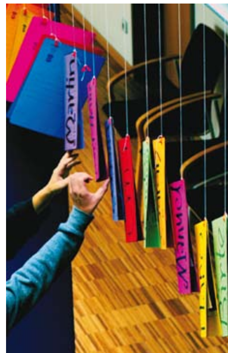
Portraitmappen während der Finissage

Wie der Sound der vier KlangkünstlerInnen, die mit und ohne Instrument eine tolle Performance boten. Dank auch den drei großartigen Assistentinnen, bis zur Finissage unermüdlich aktiv; sie alle haben Ausstellung und Finissage zu einem unvergesslichen Erlebnis gemacht. Dan-