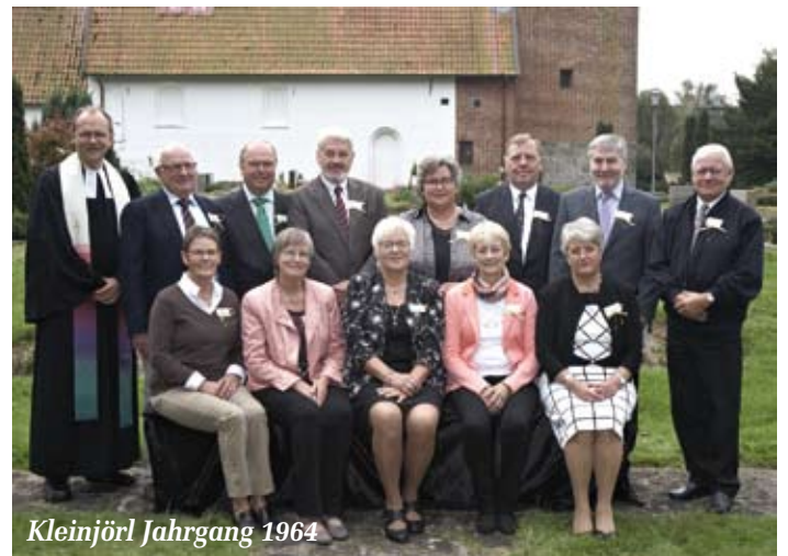
Kleinjör! Jahrgang 1964

Konfirmanden besucht und über Veränderungen der letzten Jahrzehnte berichtet. Nach so vielen Informationen ließen sich anschließend alle Gäste den Kaffee und Kuchen gut schmecken. Die Gruppenfotos wurden angeboten, und es blieb noch viel Zeit für eine angeregte Unterhaltung. Die Frage kam auf: „Gibt es in zehn Jahren eine Diamantene Konfirmation?“ Na, das ist ja noch eine ganze Weile hin! Warten wirs ab. Der Kirchengemeinderat dankt allen Teilnehmern für die schönen gemeinsam verbrachten Stunden und freut sich erst einmal auf die nächste Goldene Konfirmationsfeier in zwei Jahren