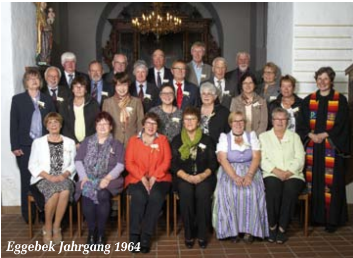
Eggebek Jahrgang 1964