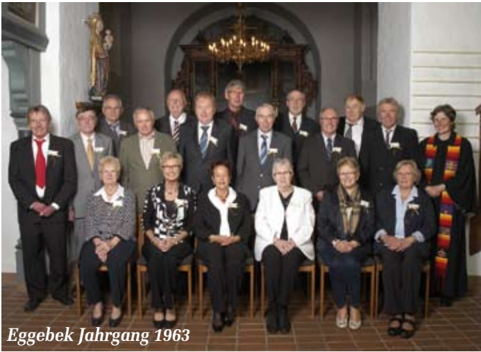
Eggebek Jahrgang 1963