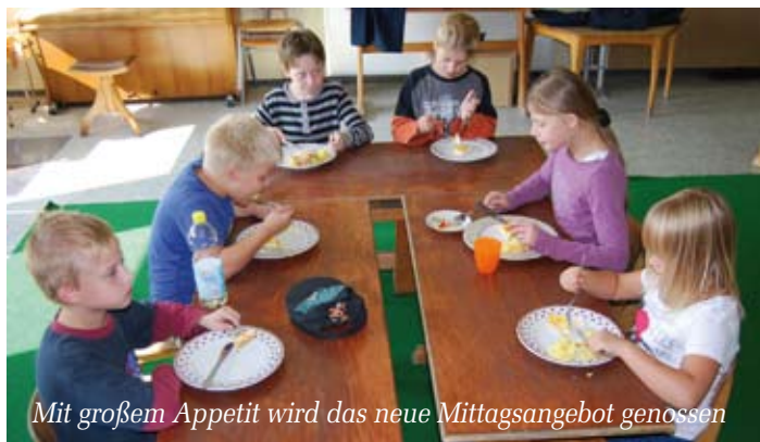
Mit großem Appetit wird das neue Mittagsangebot genossen