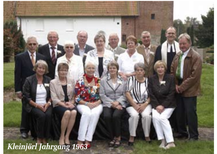
Kleinjör! Jahrgang 1963