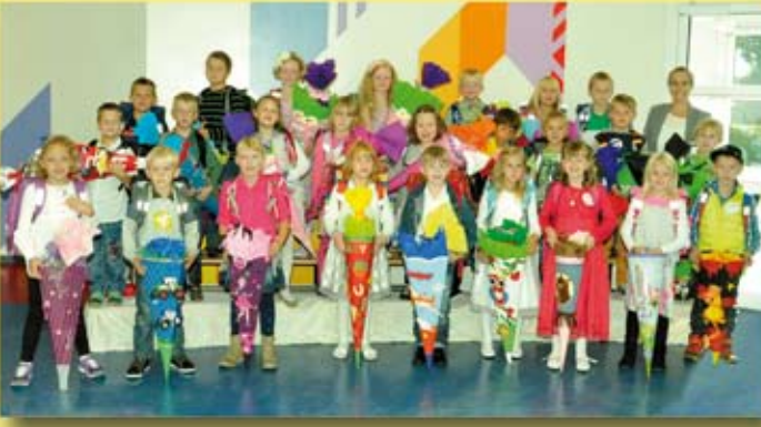
Grundschule Eggebek Klasse 1a Klasse 1b ➔