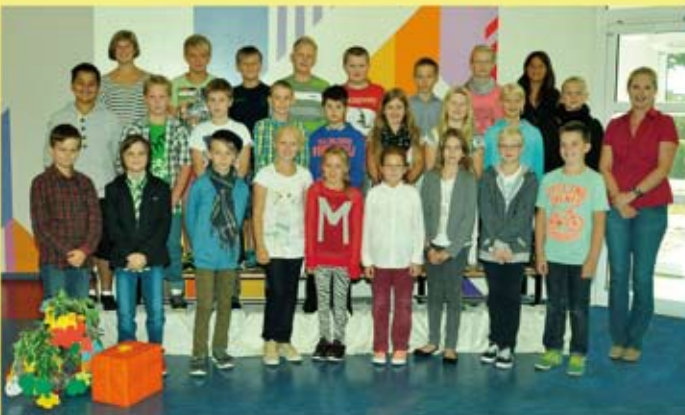
Gemeinschafts- schule Eggebek Klasse 5a Klasse 5b ➔