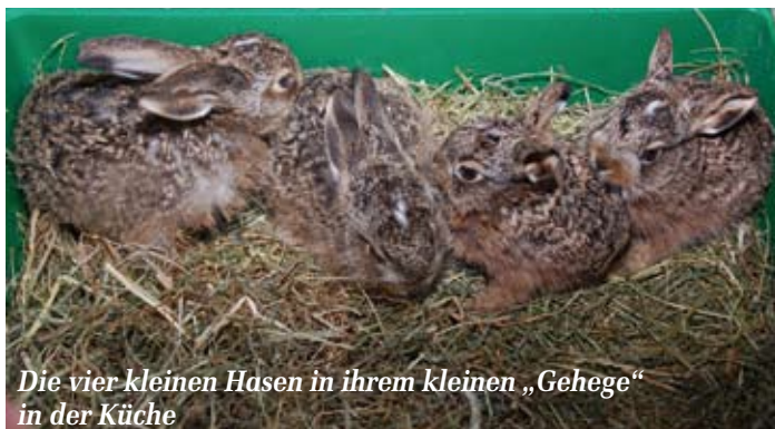
Die vier kleinen Hasen in ihrem kleinen „Gehege“ in der Küche

Tel.: 04885-902064, Fax: 04885-902065, Mobil: 0175 5753431, naturschutzstation.ets@llur.landsh.de, www.eider-treene-sorge.de .