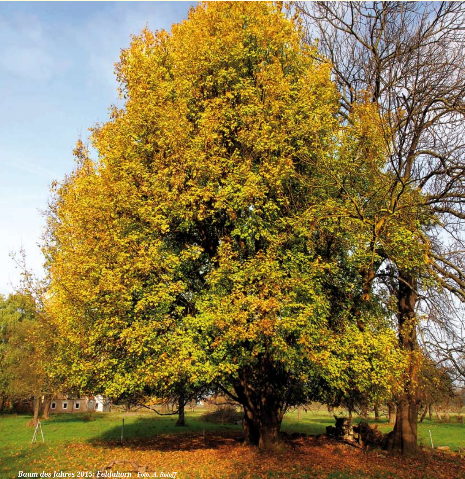
Baum des Jahres 2015: Feldahorn