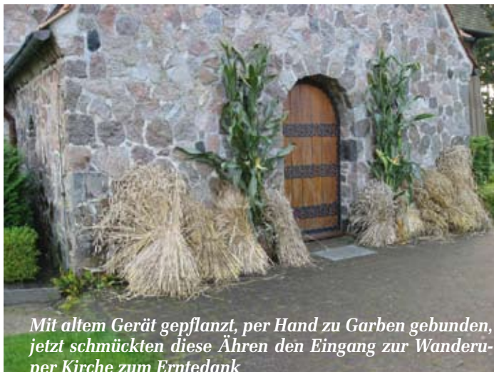
Mit altem Gerät gepflanzt, per Hand zu Garben gebunden, jetzt schmückten diese Ähren den Eingang zur Wanderuper Kirche zum Erntedank