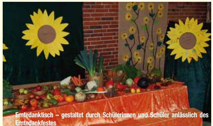
Erntedankfest – gestaltet durch Schülerinnen und Schüler anlässlich des Erntedankfestes

Frühbetreuung ab 7.15 Uhr sowie Betreuung nach dem Unterricht bis 14.00 Uhr, Ferienbetreuung in den Oster-, Sommer- und Herbstferien (in Kooperation mit der Eichenbachschule Eggebek). Mittagessen mit täglich frisch zubereiteten Speisen inklusive Dessert. Mittagessen in der Mensa mit täglich frisch zubereiteten Speisen aus der schul-eigenen Küche.