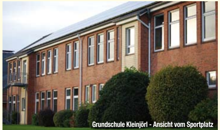
Grundschule Kleinjör! - Ansicht vom Sportplatz

Durch einen kostenfreien Bustransfer kann die Schwimmhalle der Eichenbachschule in Eggebek regelmäßig für den Schwimmunterricht in den Klassen 3 und 4 genutzt werden.