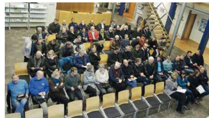
Die versammelten Gemeindevertreter aller acht Gemeinden im Forum des Dienstleistungszentrums während der allgemeinen Präsentation

Den Aufwand für die Erschließung der knapp 800 Haushalte in den wei-