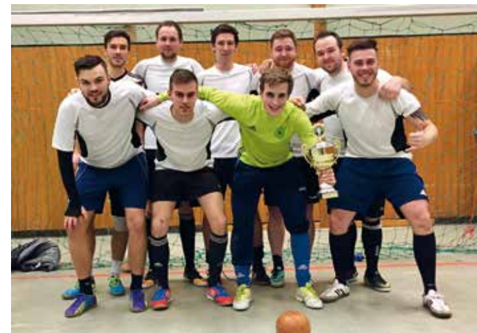
Die Siegermannschaft „AllStarZ“

Siegermannschaft, den „AllStarZ“, zum Turniersieg! Natürlich möchten wir die Zweit- und Drittplatzierten, die „Kaufris“ und „Lokomotive Langstedt“ nicht unerwähnt lassen. Die angetretene Frauenmannschaft, noch morgens in Gelting Hallenpunkttrunde gespielt, hat sich dieser „Männerrunde“ auch wieder gestellt. Mit einem 4. Platz wurde diese Mühe dann auch belohnt.