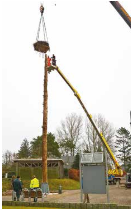
Das Storchennest wird am neu errichteten Lärchenmast befestigt

Mäharbeiten, Vertikutierarbeiten sowie das Laubsaugen auch größerer Flächen durchgeführt werden. Trotzdem ist das Gerät außerordentlich wendig. Die Anschaffungskosten belaufen sich auf ca. 45.000 €. Da der Umfang der Gemeindearbeiten auch durch die Erschließung neuer Baugebiete immer umfangreicher wird, beschloss die Gemeindevertretung zur Professionalisierung des Arbeitseinsatzes die Anschaffung dieses Gerätes. Stellv. Bauausschussvorsitzender Rüdiger Kaluza berichtete über die Bestandsaufnahme der Straßenbeleuchtung, die ein vom Bauausschuss speziell eingerichteter Arbeitskreis vorgenommen hat. Danach empfiehlt sich die Erneuerung von 37 Lampen im Bereich Dammlöcke/Sandkuhle mit LED-Leuchtkörpern. Durch die zu erzielende Stromersparnis rentiert sich die Umrüstung nach 8-10