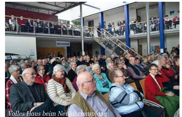
Volles Haus beim Neujahrsempfang