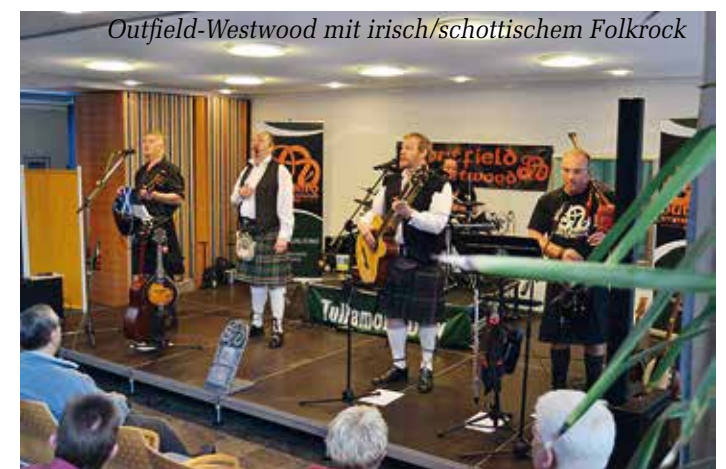
Outfield-Westwood mit irisch/schottischem Folkrock