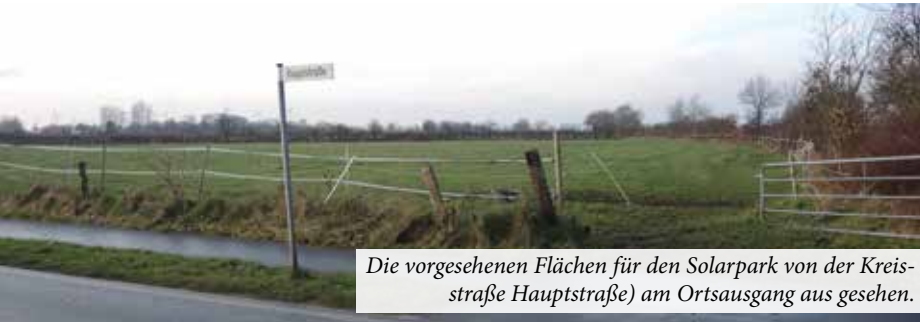
Die vorgesehenen Flächen für den Solarpark von der Kreisstraße Hauptstraße) am Ortsausgang aus gesehen.

Der Ausbau von Solarparks zur Erzeugung regenerativer Energie wird zunehmend wirtschaftlicher, so dass auch der Bau derartiger Anlagen im Norden, der nicht unbedingt von der Sonne begünstigt ist, zunehmend lohnender wird. Bereits vor neun Jahren hatte die Gemeinde Süderhackstedt mittels eines B-Planes 16 ha Fläche hierfür ausgewiesen, die dann aber nicht umgesetzt wurden. Nunmehr haben sich Investoren gefunden, die 12 ha im nächsten Jahr mit Solarmodulen bestücken werden. Mit dieser Anlage wird dann Strom für ca. 7000 Haushalte erzeugt werden. Es handelt sich dabei um vier Felder entlang des Betonspurweges hinter dem Feuerwehrgerätehaus. Seitens der Investoren besteht darüber hinaus Interessen, diesen Solarpark um weitere 37 ha zu erwei-