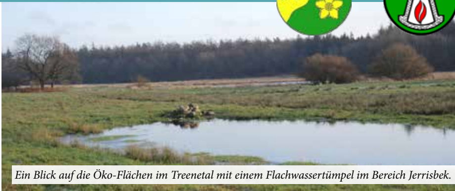
Ein Blick auf die Öko-Flächen im Treenetal mit einem Flachwassertümpel im Bereich Jerrisbek.

Vor vier Jahren hatte die Gemeinde Sollerup auf Vorschlag der Amtsverwaltung 16 ha Flächen im Treenetal erworben, um in diesem sensiblen Bereich Maßnahmen zur ökologischen Aufwertung durchzuführen. Es wurden Tümpel und Blenken, Totholzhecken, Steinhäufen für Amphibien und Anpflanzungen angelegt. Diese Maßnahme wurde vom Kreis als Öko-Konto anerkannt und mit 350.000 Öko-Punkten bewertet. Ca. 90.000 dieser Öko-Punkte konnten nunmehr für ein Windparkprojekt im Amtsbereich als Naturschutz für einen Preis von ca. 250.000 Euro veräußert werden. "Wir haben Gutes für die Natur im Treenetal gemacht und gleichzeitig unsere Haushaltslage auch für die Zukunft deutlich verbessert", bewertete Bürgermeister Ingo Hansen das Öko-Konto auf der letzten Sitzung der Vertretung. Den Haushalt 2020 wird dieser Geldsegen noch nicht ins Plus hieven, wie Amtskämmerer Florian Schöne bei der Vorstellung des Entwurfs berichtete. Der Verwaltungshaushalt hat ein Volumen von knapp 1 Mio. Euro. Die Hebesätze bleiben unverändert bei 350/370 % bei den Grundsteuern