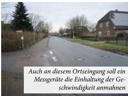
Auch an diesem Ortseingang soll ein Messgeräte die Einhaltung der Geschwindigkeit anmahnen