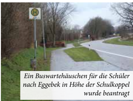
Ein Buswartehäuschen für die Schüler nach Eggebek in Höhe der Schulkoppel wurde beantragt

einem ehemaligen Hofgrundstück im Bereich Friedrichsheide ist die Errichtung eines Zucht-, Reit- und Therapiezentrums geplant. Da das Gelände im Außenbereich liegt, ist zur Schaffung von Baurecht die Aufstellung eines Bebauungs-