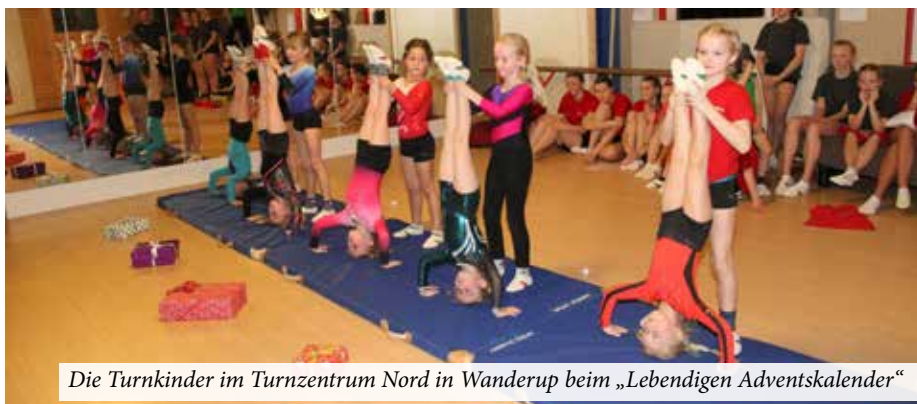
Die Turnkinder im Turnzentrum Nord in Wanderup beim „Lebendigen Adventskalender“

Am Veranstaltungsabend dann die große Überraschung: Etwa 100 Personen waren gekommen. Die meisten waren Angehörige, aber auch einige ohne irgendeine Beziehung waren dabei. Für die Kinder war es aufregend, aber auch schön. Ob es die kleinen Jungen oder die schon