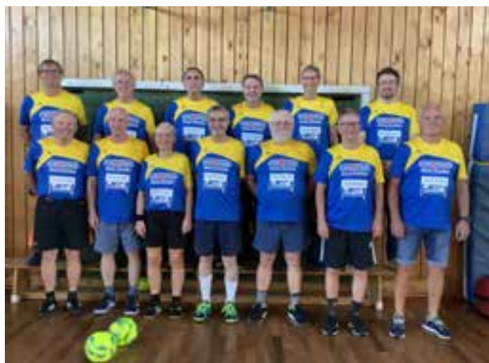
Teil des WF-Teams im gesponserten Trikot.