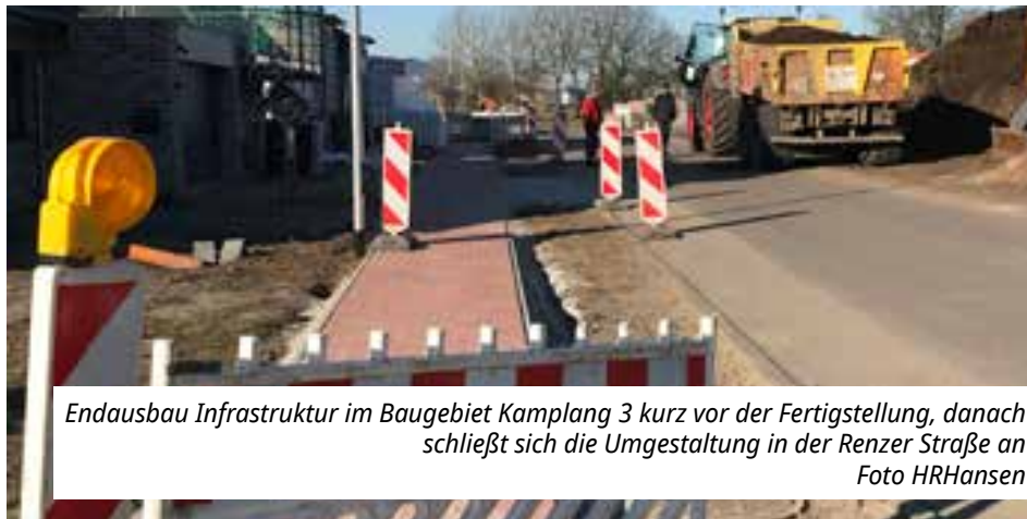
Endausbau Infrastruktur im Baugebiet Kamplang 3 kurz vor der Fertigstellung, danach schließt sich die Umgestaltung in der Renzer Straße an

Die laufende Zertifizierung der Mensa schließt sich als weiteres Thema in diesem Bereich an. 140 - 150 Essen verlassen täglich die Küche, davon 70 Essen für die Kita im Süderweg. Die Gemeindevertretung beschließt, das laufende Zertifizierungsverfahren mit der Deutschen Gesellschaft für Ernährung aufzukündigen, da die sich permanent ändernden Richtlinien die Essenszubereitung stark einschränken. Das Essen kommt bei einigen Kindern geschmacklich nicht mehr so gut an. Klar bleibt das Bekenntnis zu einer vollwertigen Ernährung. Angestrebt wird ein mit den Mensen in Jörl und Eggebek erstelltes Label, das mehr auf Regionalität, gesunde Ernährung und Nachhaltigkeit abzielt.