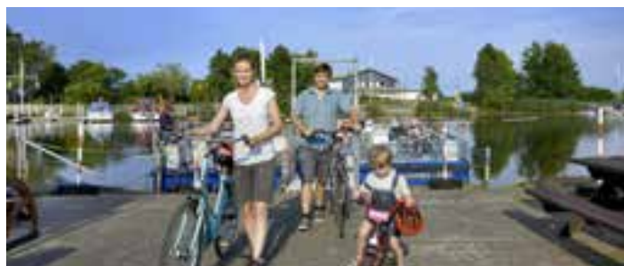
Die beliebten Kleeblatt-Radtouren entlang der Hohner und Bargener Fähre sollen optimiert werden.